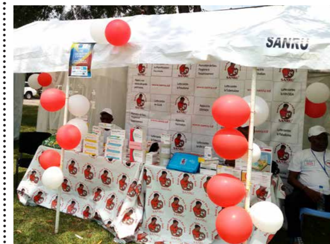
Vue du stand de SANRU asbl à la célébration de la JMP 2019 à l'académie des beaux arts

La séance de briefing a été organisée le 24 Avril, à l'intention des professionnels des médias afin de les tenir informé sur les avancées en termes de lutte contre le Paludisme dans le Pays et de les sensibiliser sur le rôle qu'ils ont à jouer en tant