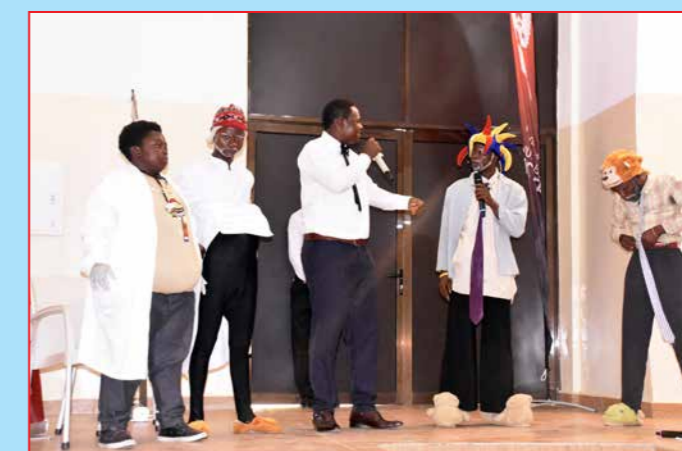
La Troupe théâtrale, GROUPE BAMPENA, présentant un sketch pendant la cérémonie de lancement

SANRU ASBL, UNE INSTITUTION TRAVAILLANT AUX NORMES INTERNATIONALES !