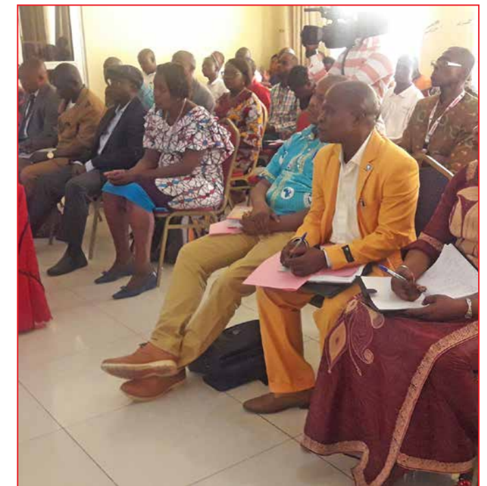
Vue partielle des participants à la conférence de presse à Kindu

C'est dans ce cadre que du 13 Avril au 14 Juin 2019, une équipe constituée du personnel de la Direction des Etablissement de Soins et Partenariat (DESP), de la Direction de Pharmacie, Médicaments et Plantes Médicinales (DPM), du Programme National de Lutte contre le Paludisme (PNLP), de la Cellule d'Appui à la Gestion Financière du Ministère de la Santé (CAGF) et de SANRU asbl, ont organisé dans chaque ville d'implémentation, des rencontres de sensibilisation et une plénière de plaidoyer en vue de susciter l'adhésion et la participation des partenaires du secteur privé (Fabricants, importateurs/dépôts, propriétaires et prestataires des pharmacies et cliniques) à la politique nationale de prise en charge du paludisme ■