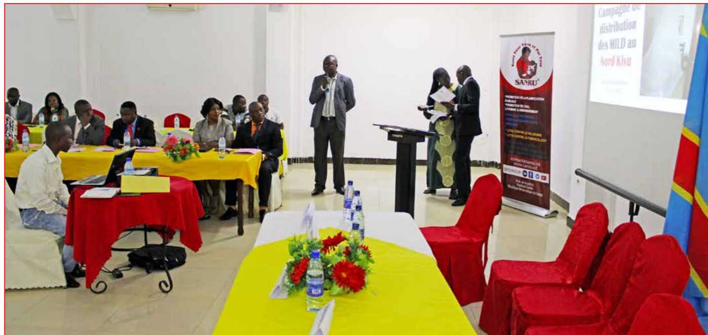
Présentation de la mise en oeuvre de la campagne par le Directeur du PNLP

le paludisme dans sa province. Il a indiqué, que le Nord-Kivu assurera la mobilisation de tous les acteurs de la société afin :