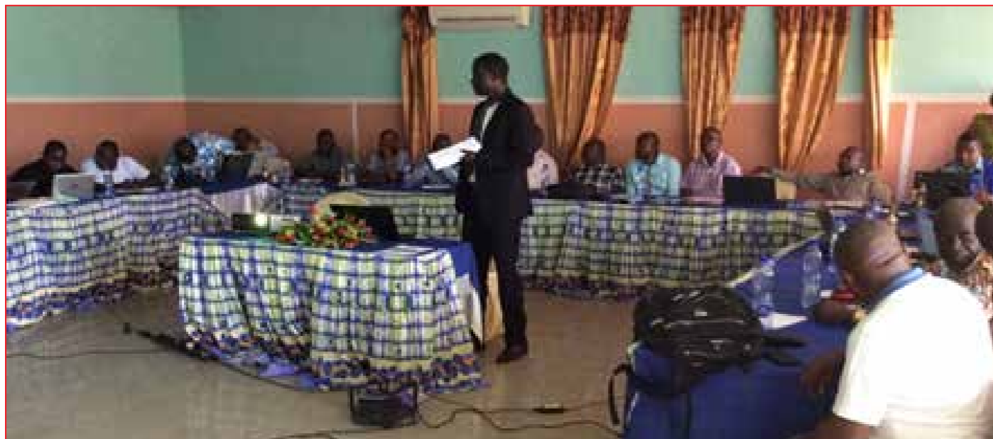
Insérer une légende

Il s'est tenu dans la salle «Barreau de MATADI », située au Quartier RTNC dans le KONGO CENTRAL, du 06 au 12 Février 2019, l'atelier d'élaboration de macros plans des campagnes de distribution des MILD pour les 12 provinces en 2019.