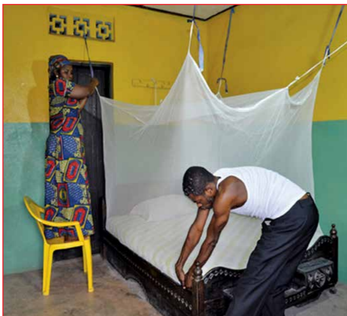
Se protéger des moustiques par l'utilisation d'une moustiquaire imprégnée d'insecticide