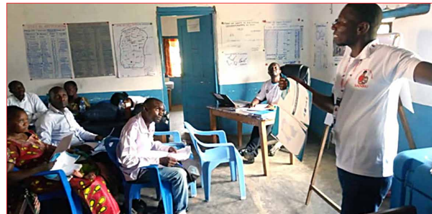
Formation des Relais communautaires par le Point Focal Provincial Haut Lomami/ SANRU SBC

Au total, 3531 agents de surveillance à base communautaire ont été formés en cascade. Après le briefing, l'équipe de la DPS Haut Lomami et les 3 points focaux de SANRU asbl ont formé 9 membres des Equipes Cadre des 3 zones de santé (ECZs) de la province. À leur tour, ils ont formé 128 infirmiers titulaires et leurs adjoints qui, pour leur part, ont formé, sous la supervision des ECZs et des points focaux SANRU asbl, 3007 Agents de surveillance à Base Communautaire (ASBC) RECOS, 192