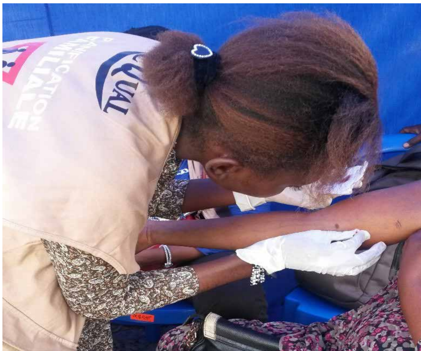
A Bandalungwa, une dame qui vient se faire retirer l'implano

S ANRU asbl, par son projet AcQual, a organisé des mini campagnes durant le mois de Mars 2019 dans la ville province de Kinshasa au niveau des zones de santé de Masina 1, Bumbu, Bandal, Barumbu, Kalamu II, Lemba, Lufungula (Police) et Kingasani.