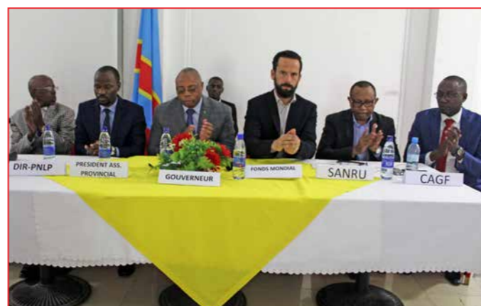
Intervention du gouvernement