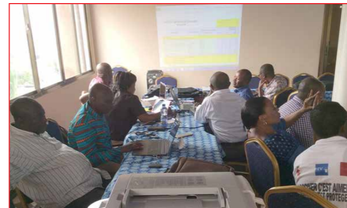
Vue partielle des participants à l'atelier

Il a invité tous les participants au travail. « La macro planification précède tout », a-t-il laissé entendre. Etant donné la longue procédure pour faire arriver les MILD, de l'usine de fabrication aux ménages, il faudrait donc bien quantifier toutes