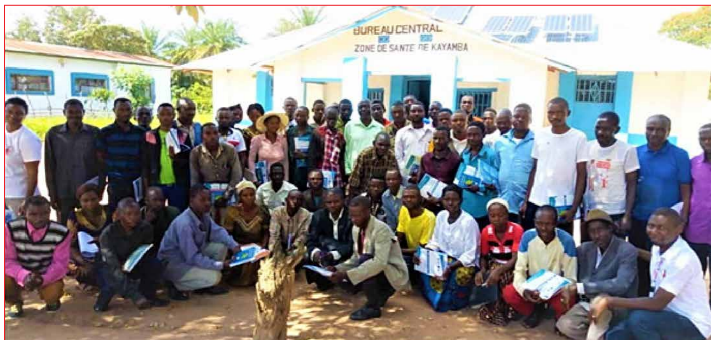
Les Infirmiers Titulaires, les formateurs de la ZS, de l'OMS et l'équipe SANRU SBC, après la formation sur la surveillance des maladies évitables par vaccination au BCZS de KAYAMBA

Dans le souci de contribuer à l'amélioration de la surveillance à base communautaire en République Démocratique du Congo, le projet SBC SANRU financé par la Fondation Bill et Melinda GATE a organisé, du vendredi 15 au jeudi 21 Mars 2019, une session de formation sur la surveillance des PFA (Paralysies Flasques Aigües) et d'autres maladies évitables par la vaccination (Rougeole, Fièvre jaune, Tétanos néonatal) dans la Division Provinciale de Santé (DPS) du Haut Lomami.