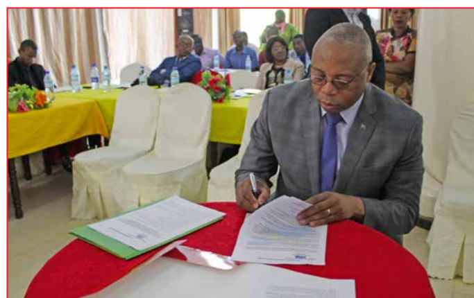
Signature de l'acte d'engagement par le Gouverneur de province

Pour matérialiser l'engagement de la province à soutenir le processus de la distribution gratuite des moustiquaires aux ménages, un acte d'engagement a été signé par les autorités politico administratives. Il sied de noter que les médias ont couvert la séance de plaidoyer et que celle-ci a été relayée dans les différents journaux pour une sensibilisation tous azimuts ■