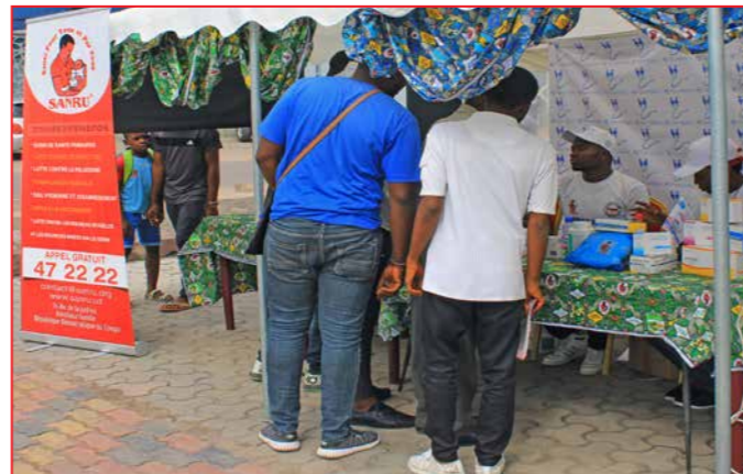
Sensibilisation de la population par l'équipe de SANRU

Toutes les activités mises en oeuvre par SANRU, viennent en appui au Programme National de