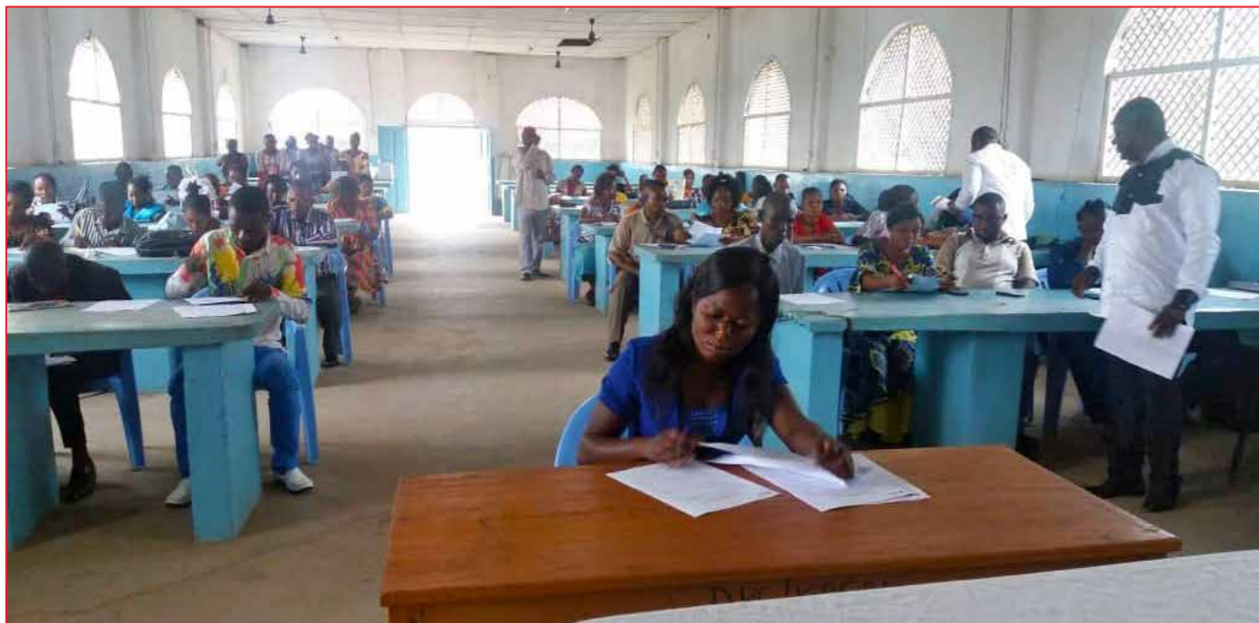
Signature de l'acte d'engagement par une infirmière, lors de la cérémonie à Tshikapa, au Kasai.

SANRU Asbl, à travers son projet BOMOYI, œuvre pour l'amélioration de la santé de la mère, du nouveau-né, de l'enfant et de l'adolescent (SRMNEA). Son principal objectif est de contribuer à la réduction de la morbi-mortalité infantile et maternelle. Une des stratégies mis en œuvre pour atteindre cet objectif est la reconversion des infirmiers A1 en sage-femme grâce à une formation de 12 mois dans les Instituts Supérieurs Techniques et Médicaux (ISTM).