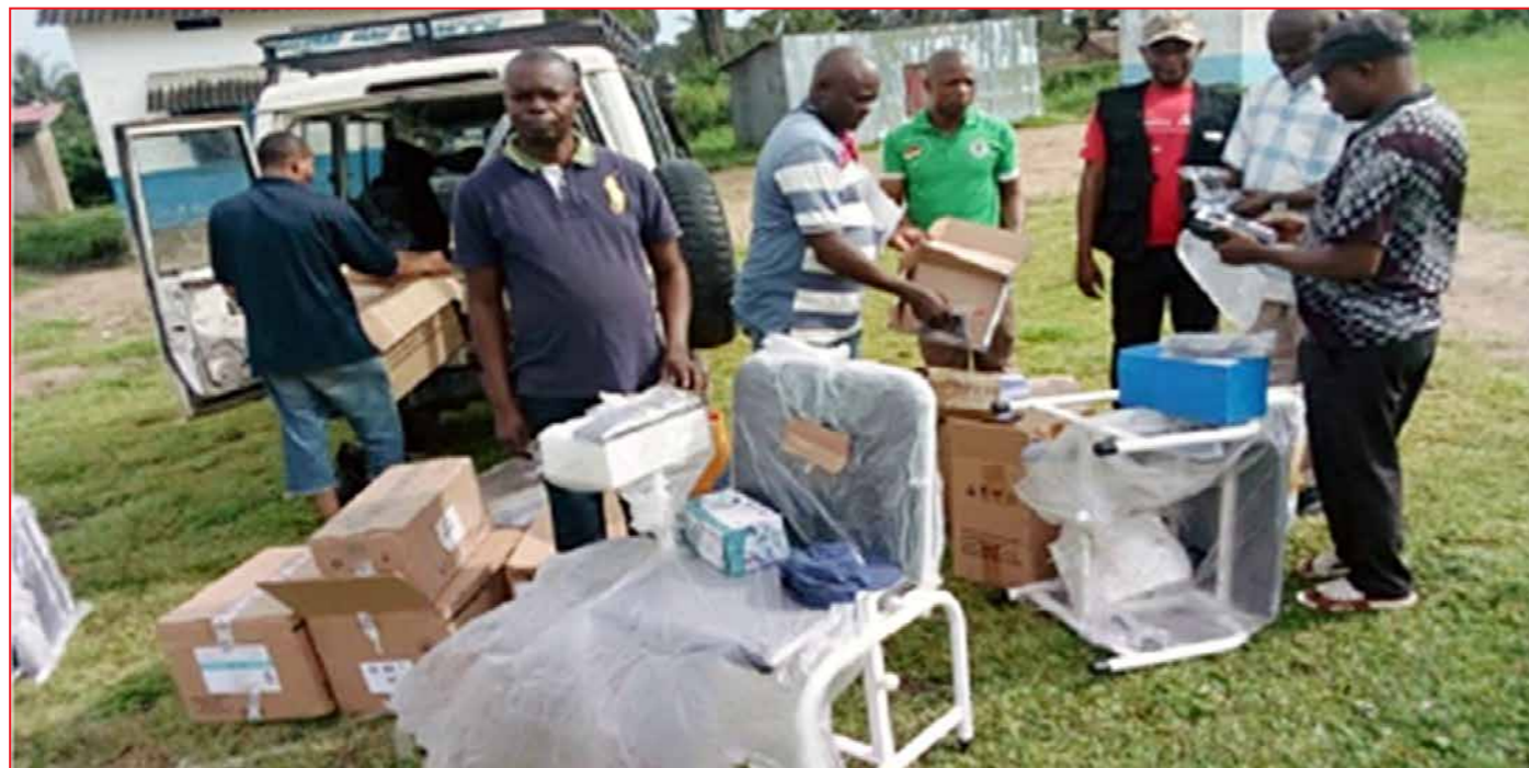
Don des équipements médicaux et matériels de fonctionnement

Dans le cadre du renforcement institutionnel des 28 ZS appuyées par le projet ASSP mis en œuvre par SANRU asbl dans les Divisions Provinciales de Santé (DPS) de Kasai et Kasai Central, le projet a doté, en Février 2019, les zones de santé en matériels/équipements médicaux et non médicaux.