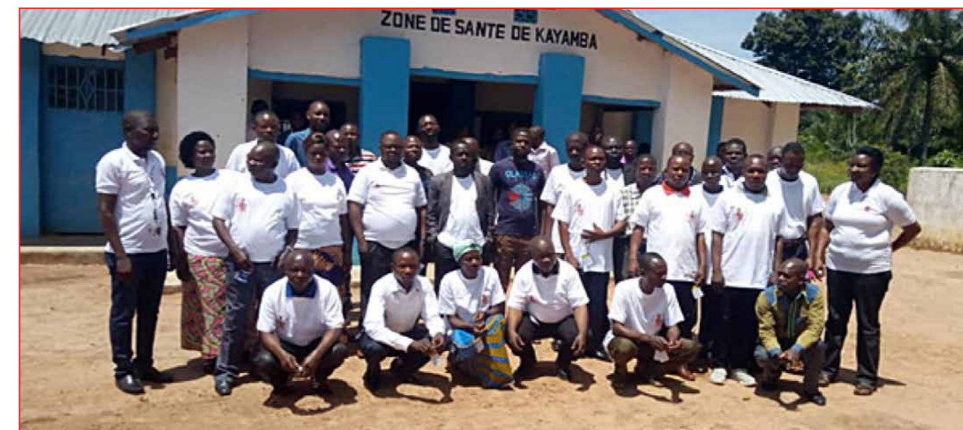
Photo de famille après la formation des ECZs des ZS KAMINA, KANIAMA et KAYAMBA

communautaire selon l'approche actualisée, la dynamique communautaire, la présentation de la fiche technique PFA version Mars 2018 et des directives PFA version Février 2019 AFRO, l'organisation et le fonctionnement des structures de participation à base communautaire, les techniques de communication en surveillance à base communautaire et la présentation des outils de formation et de collecte des données de la SBC ■